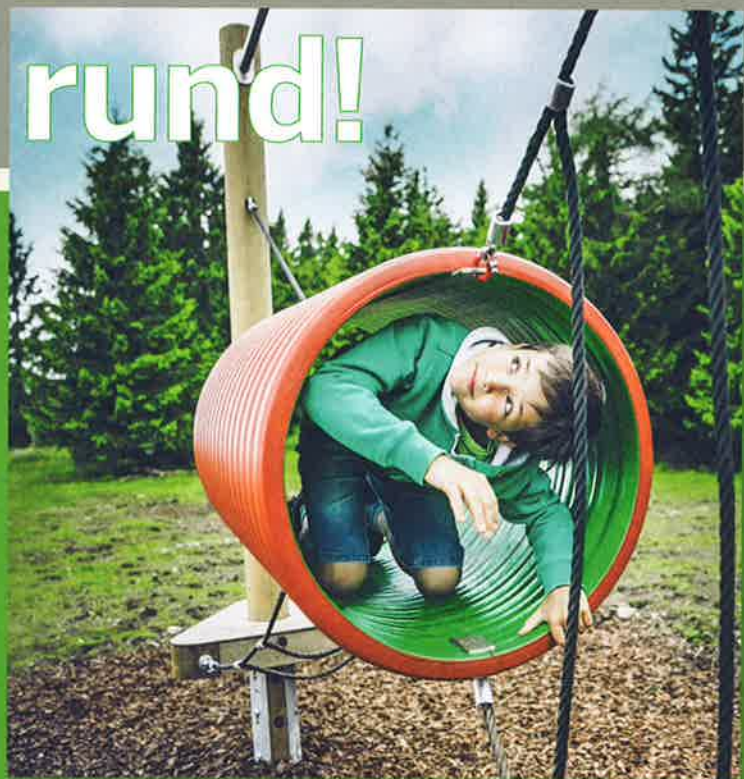
Alles in Schwebе: Der Motorikpark des Schöckls macht nicht nur Spaß, er ist auch gesund!

die schon! Den Hexenexpress genießen Mamas, Papas und Kinder auch gleichermaßen. Durch sieben Kurven und über zwei Jumps düst man auf der komfortabel-sportlichen Rodel vorbei an staunenden Zaungästen zu Tal. Und: Auf dem Schöckl gibt es auch die Schöckl Trail Area und neuerdings einen Kletterpark!